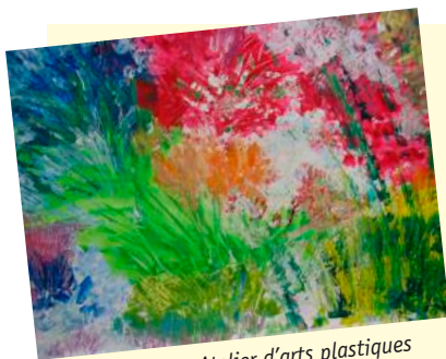
Illustration : Atelier d'arts plastiques

Les feuilles se bouscuaient entre elles pour libérer la vue. Je le voyais en plein jeu avec un petit chien. Tout content il me faisait signe en bondissant de plus en plus haut. C'est sûr, s'il le veut il pourra bondir dans l'autre sens pour rentrer. Il est très intelligent. Il saura toujours trouver des amis et son chemin.