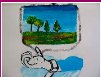
Illustration: Atelier d'arts plastique du GEM Maison Bleue

http://www.logos66.com contact@logos66.com Tél. 06 14 46 31 00